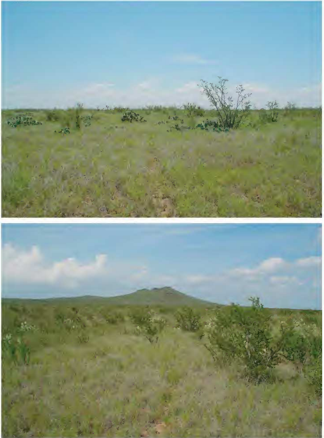
FIG. 2. Arriba: zacatal dominado por Hilaria mutica con arbustos aislados de Opuntia lindheimeri , principal especie en las áreas con sobrepastoreo, Abajo: zacatal de Hilaria mutica con presencia de arbustos de Acacia rigidula y Opuntia lindheimeri , al fondo se observa el cerro de Agua Dulce principal elevación del área de estudio.